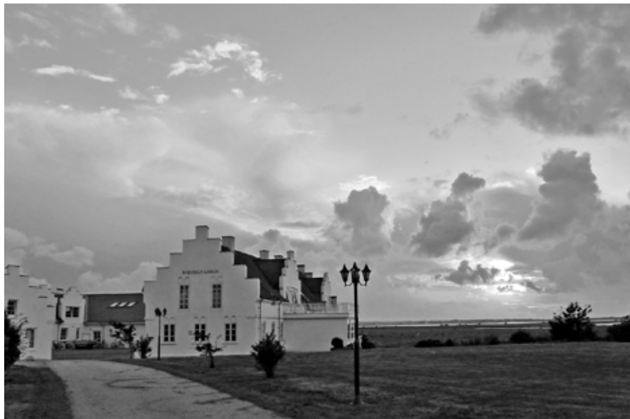
Deltagerne i Thy Kammermusikfestival indlogeres på Bakkegården i Vesløs i det smukke landskab mellem Nationalpark Thy og Limfjorden.

Fjerde sats, Finale: Andante – Vivace , bringer os tilbage til virkeligheden: med kantede melodiske linjer og stærke dynamiske og rytmiske kontraster danner finalen et herligt og humørfyldt modbillede til den overmåde lyriske fylde, der ellers kendetegner værket.