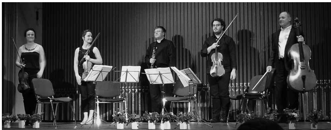
Thy Kammermusikfestival On Tour 2015