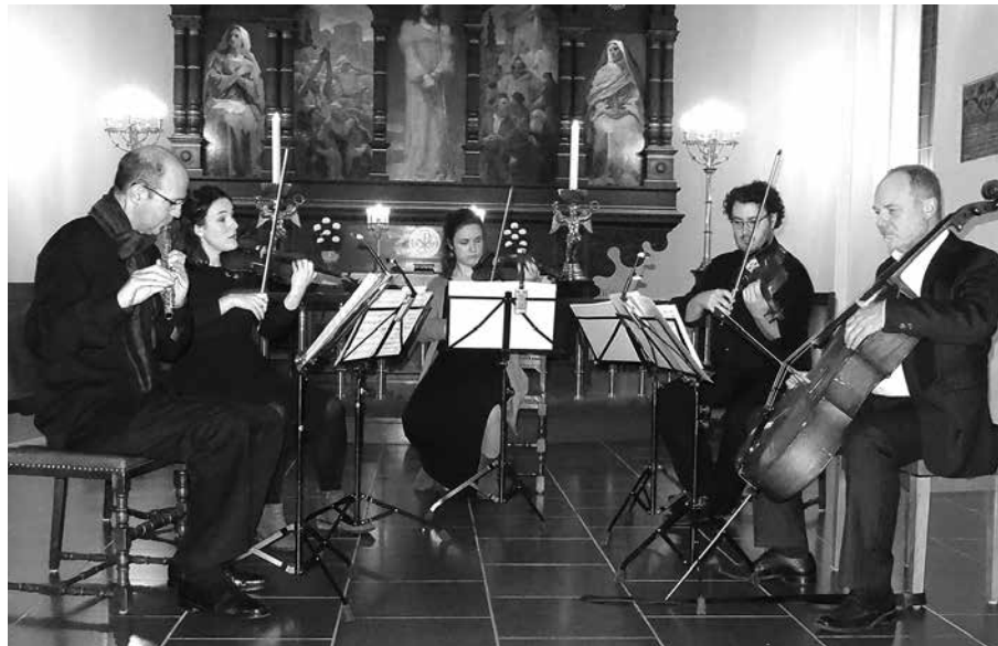
Vor Frue Kirke, Aalborg