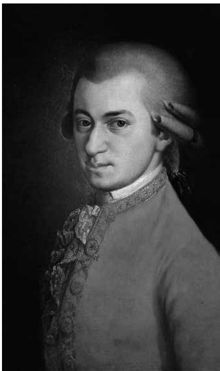
Posthumt portræt af Wolfgang Amadeus Mozart fra 1819. Kunstneren er Barbara Krafft