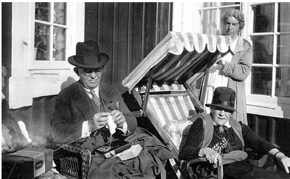
Foto fra 1920'erne. Carl Nielsen og hans hustru, Anne Marie Brodersen, holder ferie i Jonsered i Sverige.

Kvintettens fjerde og sidste sats er en overstrømmende Finale: Allegro molto . Det fyndige hovedtema og det lette og livsglade sidetema leverer stof til gennemføringsdelen. Efter reprisen følger en koda, der udvikler sig til en brillant og glansfuld slutning ( Presto ).