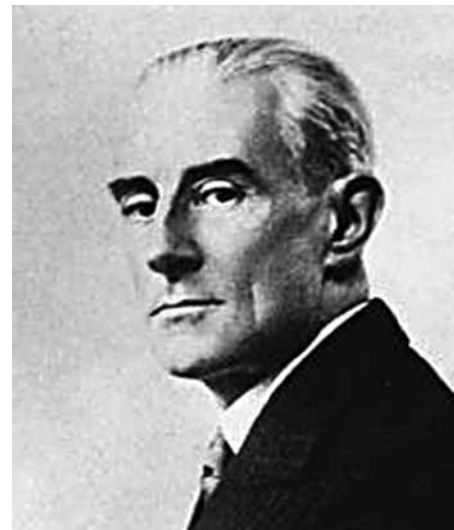
Maurice Ravel (1875-1937)

af satsen sammenfatter Ravel sonatens temaer i et virkningsfuldt kontrapunktisk klimaks.