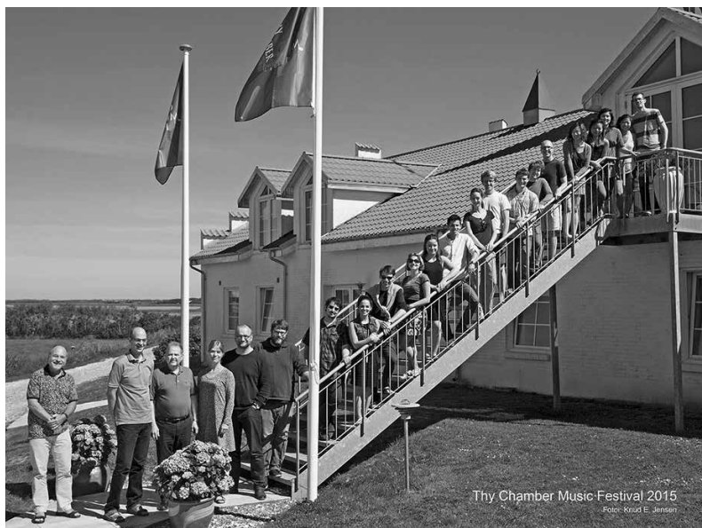
Deltagere i Thy Kammermusikfestival 2015