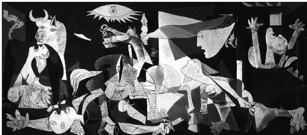
Pablo Picasso, Guernica (1937)

(Solomon Volkov, Testimony: The Memoirs of Dmitri Sjostakovitj , 1979)