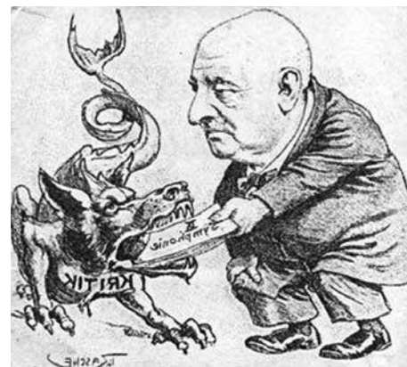
Anton Bruckner og kritikken

Bruckner var en grænseløs beundrer af Richard Wagner. I 1873 blev han optaget som medlem af Wagnerselskabet i Wien. Dermed blev han – uden at ønske det – et passivt midtpunkt i det store spektakel mellem den progressive fløj (tilhængerne af Richard Wagner og Franz Liszt, "nytyskerne") og tilhængerne af klassicisten Brahms, der sammen med den begavede og skarpe kritiker Eduard Hanslick anså Bruckner for at være en formløs eftersnakker, der blot ønskede at overføre Wagners musikdramatiske stil til symfoniens område. Bruckner på sin side tog ikke til genmæle. Han var ganske enkelt ude af stand til at formulere sig polemisk eller sarkastisk over for nogen som helst.