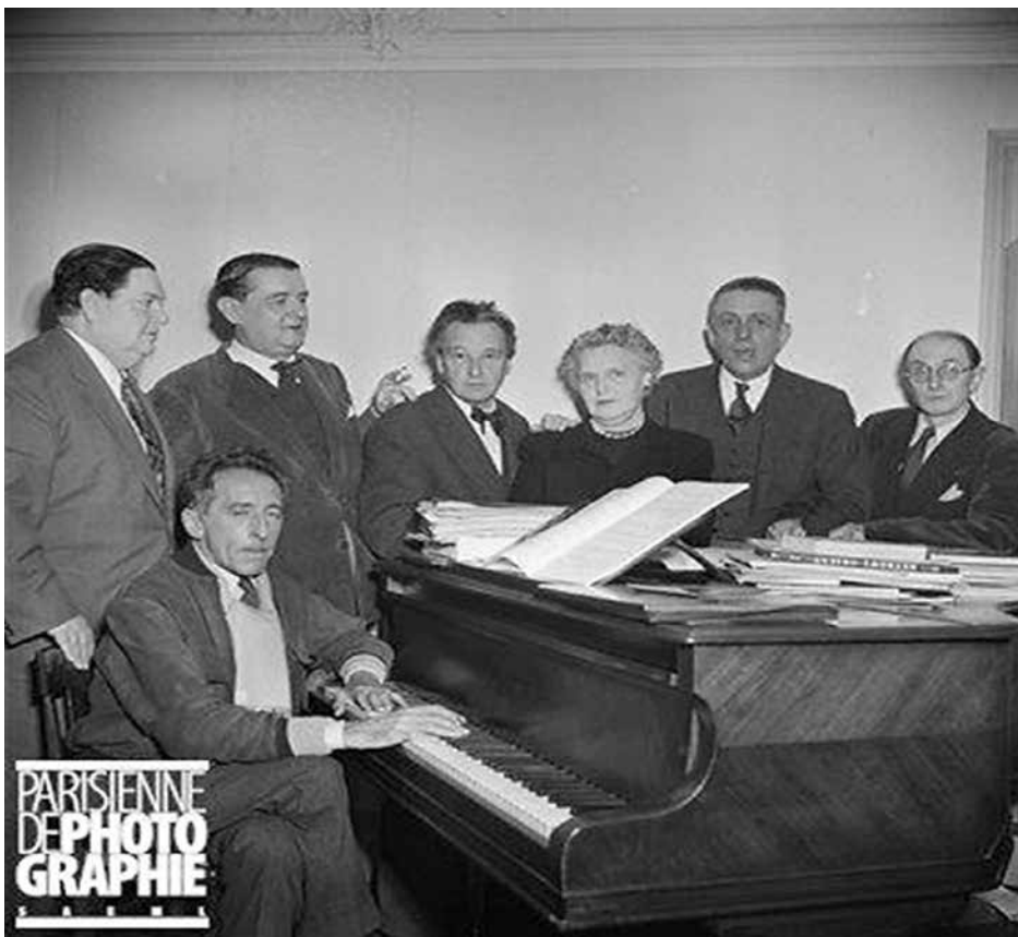
Paris, december 1951. Komponistgruppen Les Six . Stående fra venstre: Darius Milhaud, Georges Auric, Arthur Honegger, Germaine Tailleferre, Francis Poulenc og Louis Durey. Ved klaveret: Jean Cocteau.

Poulenc komponerede sin Sonate op. 164 for fløjte og klaver i 1956. Den er teknisk brillant og fuld af musikalsk ynde og charme – egenskaber, der netop karakteriserer den franske fløjtetradition.