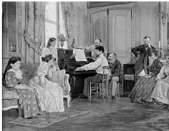
August 1893. Claude Debussy spiller klaver; Ernest Chausson vender blad, medens billedkunstneren Henry Lerolle ser til.

Tredje sats, Assez lent , er igen mørk og indadvendt i sin karakter. Klaveret indleder, men snart slutter celloen sig til, og sammen spiller de en melankolsk arie, der gradvis bygger op mod et højdepunkt, hvor violinen bliver førende stemme.