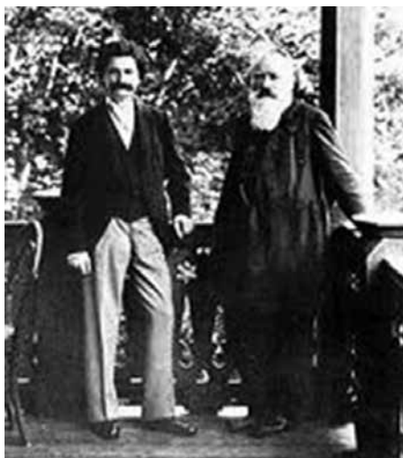
De to nære venner, Johann Strauss (den yngre) og Johannes Brahms, er her fotograferet i Wien 1894.

Den tyske komponist og pianist Johannes Brahms (1833-97) voksede op i Hamburg, hvor han fra sit syvende år fik regelmæssig undervisning i klaver, senere også i teori og komposition. I 1848 – som 15-årig – trådte han offentligt frem som pianist. Det fik stor betydning for Johannes Brahms, at han som 20-årig mødte den ungarske violinist Eduard Reményi. Med ham turnerede han i Tyskland, hvor han mødte mange fremtrædende musikere og komponister, i Weimar Franz Liszt, hvis musik han ikke brød sig om, og i Düsseldorf Robert og Clara Schumann, med hvem han sluttede et livslangt venskab. Robert Schumann var begejstret. I Neue Zeitschrift für Musik hilste han Brahms som den "unge ørn", der med sit geni ville skabe fornyelse i tysk musikliv. På den måde