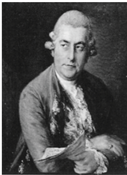
Johann Christian Bach, malet af Thomas Gainsborough 1776

I musikhistorien indtager Johann Christian Bach (med tilnavnet Milano- eller London-Bach ) en central plads, idet han med sine værker fra 1760'erne og 70'erne, ikke mindst de italiensprægede symfonier, bidrog til at skabe det stilistiske grundlag for wienerklassikken, den musikalske stilperiode, der med Wien som centrum og med Haydn, Mozart og den unge Beethoven som centrale komponister blomstrede i årene ca. 1770–1800.