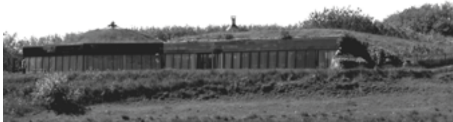
Nordisk Folkecenter for Vedvarende Energi