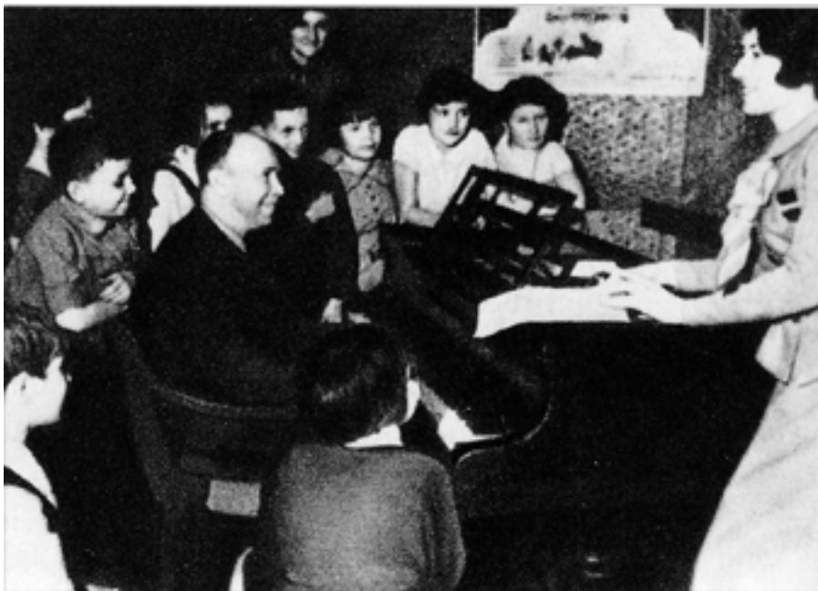
Prokofjev spiller og fortæller Peter og Ulven for første gang i april 1938. Tilhørerne er børn på Centralbørneteateret i Moskva.

kantater og programsymfonier i neoklassisk stil. Også Prokofjev komponerede i årene efter 1936 enkel, patriotisk brugsmusik, bl.a. det pædagogiske melodrama Peter og Ulven 1936, musik til S. Eisensteins film Alexander Nevskij 1938 og balletten Romeo og Julie samme år. Selv om myndighederne ofte kritiserede hans musik for at være "formalistisk", modtog han to gange den eftertragtede Stalinpris.