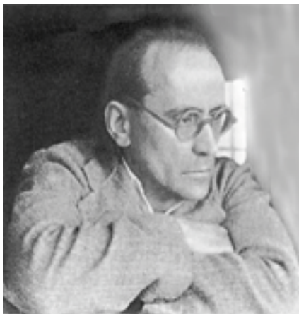
Anton Webern, udateret foto

Værket slutter med en livlig fjerde sats, hvor forholdet mellem klaver og strygere er lige så perfekt afbalanceret som i de foregående satser. Dvořáks interesse for at belyse sit temastof kontrapunktisk kommer til udtryk i gennemføringsdelens slutning, hvor hovedtemaet danner grundlag for et virkningsfuldt fugato.