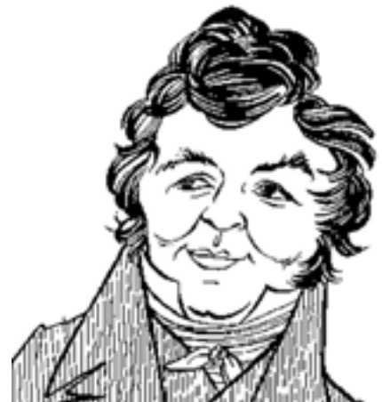
Johann Nepomuk Hummel

17 år senere – i 1819 – komponerede Schubert sin Forellekvintet , hvis besætning (violin, bratsch, cello, kontrabas og klaver) udtrykkeligt er inspireret af Hummels klaverkvintet i es-mol op. 87.