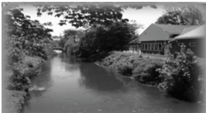
Morup Mølle Kro