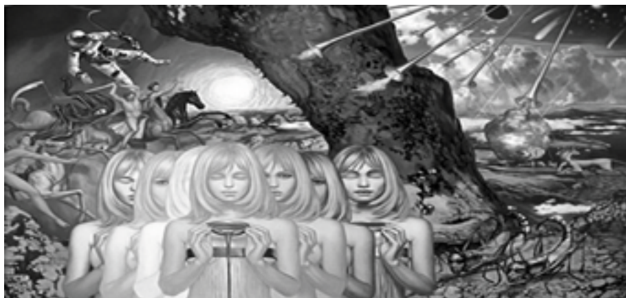
Michael Maschka, Johannes' Apokalypse 2006

Morgenappel i den tyske krigsfangelejr Stalag VIII A, hvor Messiaen i 1940-41 komponerede Kvartet til tidens ende inspireret af Apokalypsen fra Johannes' Åbenbaring. Stalag er en forkortelse af Mannschafts-stamm und -strafflager. Billedet er taget med skjult kamera af en new zealandsk krigsfange i 1943. Krigsfangelejren Stalag VIII A lå øst for Görlitz i det daværende Tyskland, i dag Zgorzelec, Polen. Før 1939 blev lejren anvendt af Hitlerjugend. I oktober 1939 blev lejren indrettet til 15.000 polske krigsfanger fra den tyske septemberoffensiv. I 1940 blev de polske fanger transporteret til andre lejre og erstattet af belgiske og franske soldater, der blev taget til fange under kampene om Frankrig. På et tidspunkt boede 30.000 fanger i lejren, der var indrettet til 15.000. I 1943 ankom 2.500 australske og new zealandske soldater fra kampene i Italien og i december 1944 1.800 amerikanske fra kampene i Ardennerne.