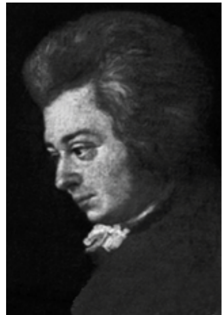
Wolfgang Amadeus Mozart, detalje af ufuldendt maleri af Mozarts svoger Joseph Lange 1789-90. Billedet blev af hans kone anset for at være det mest vellignende portræt af Mozart.

En langsom Adagio i g-mol indleder fjerde sats. Læg mærke til rollefordelingen: 1. violinen og celloen er de førende stemmer. 1. violinen udfolder en rolig, vidt udspundet melodisk linje af stor skønhed. Celloen har to funktioner. Dels kommenterer den 1. violinen med fine imitationer af det rige motiviske materiale. Derudover udfører celloen med sine pizzicati musikhistoriens smukkeste „gående bas"! De øvrige stemmer: 2. violin og to bratscher danner den diskrete, men levende og ud søgte harmoniske baggrund i gentagne ottendedele. Med sin sprudlende livsglæde virker den efterfølgende Allegro – en rondo i G-dur – som en overvældende frigørelse fra og overvindelse af den smertelige uro og indadskuende melankoli, der hvilede over de foregående satser. Her kom Mozart sit wienerpublikum i møde.