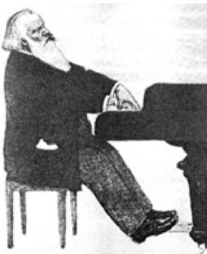
Johannes Brahms ved klaveret

Robert Schumann var begejstret. I Neue Zeitschrift für Musik hilste han Brahms som den unge ørn, der med sit geni ville skabe fornyelse i tysk musikliv. På den måde blev Brahms kendt; hans værker blev udgivet, og han kunne på længere sigt hellige sig sin virksomhed som komponist.