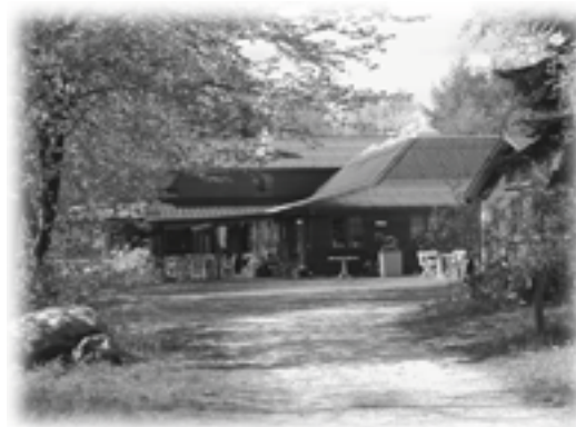
Kirsten Kjær's Museum